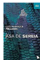
ASA DE SEREIA Autor: Luis Henrique Pellanda Editora: Arquipélago (208 págs., R$ 35)